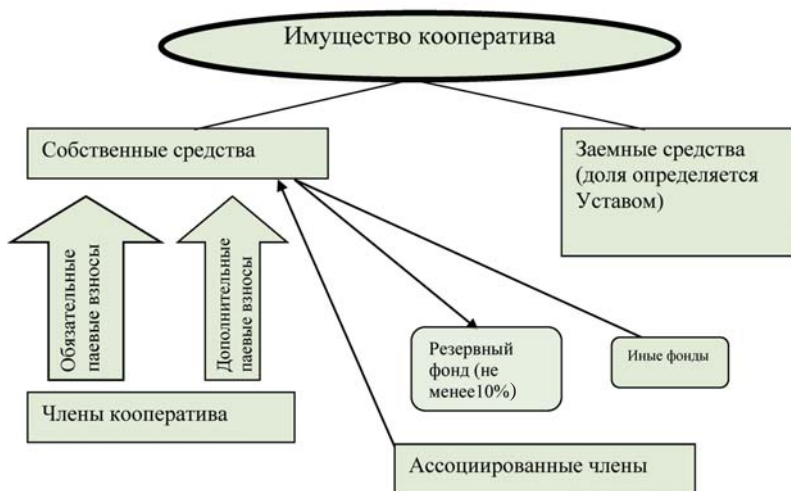
Рис. 3. Формирование имущества потребительского кооператива

Порядок формирования имущества кооператива представлен ниже (рис. 3).