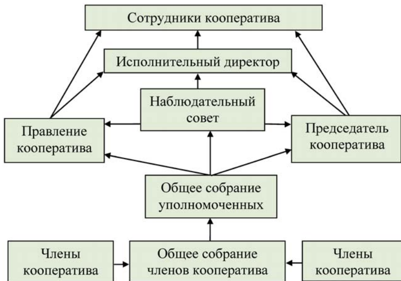
Рис. 2. Управление потребительским кооперативом

Полномочия, структура органов управления кооперативом, порядок избрания и отзыва членов правления и (или) председателя кооператива и членов наблюдательного совета кооператива, а также порядок созыва и проведения общего собрания членов кооператива либо собрания уполномоченных устанавливаются в соответствии с Законом «О сельскохозяйственной кооперации» и Уставом кооператива.