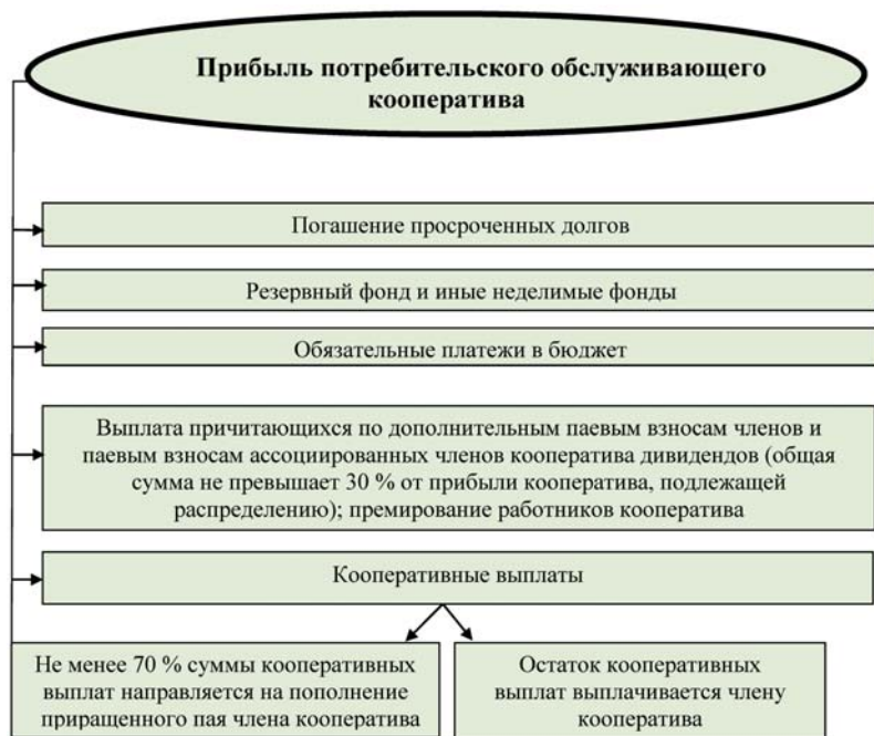
Рис. 4. Распределение прибыли потребительского кооператива

ные паи, сформированные в наиболее ранний период по отношению к году их погашения. Не допускается погашение приращенных паев, если размер паевого фонда кооператива превышает размер чистых активов кооператива или размер чистых активов кооператива в год погашения приращенных паев стал ниже по сравнению с предыдущим годом. Общая сумма кооперативных выплат, направляемая на погашение приращенных паев, не должна превышать сумму, определенную совместным решением правления и наблюдательного совета кооператива (рис. 4).